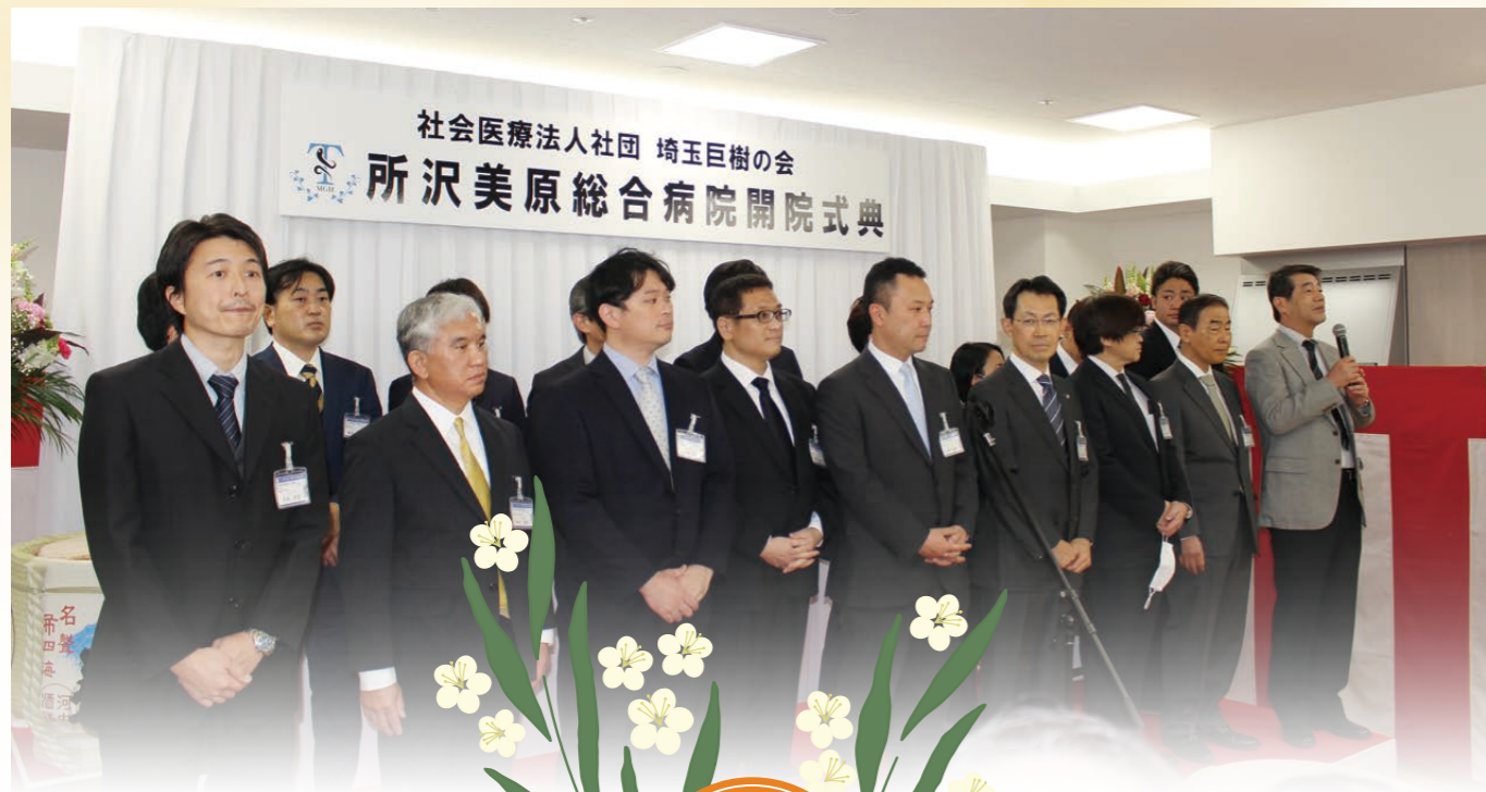
所沢美原総合病院 診療部長の紹介