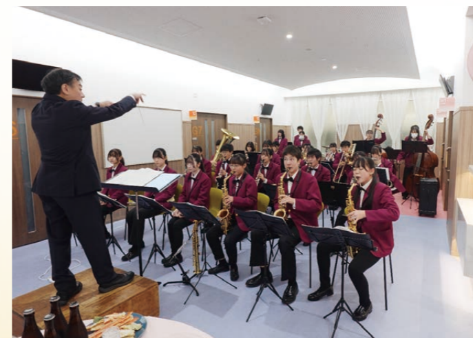
所沢北高等学校吹奏楽部による演奏

また余興では、「所沢北高等学校吹奏楽部の演奏」や「餅つき」が催され、華やかさや和みの花が添えられた盛大な会となりました。