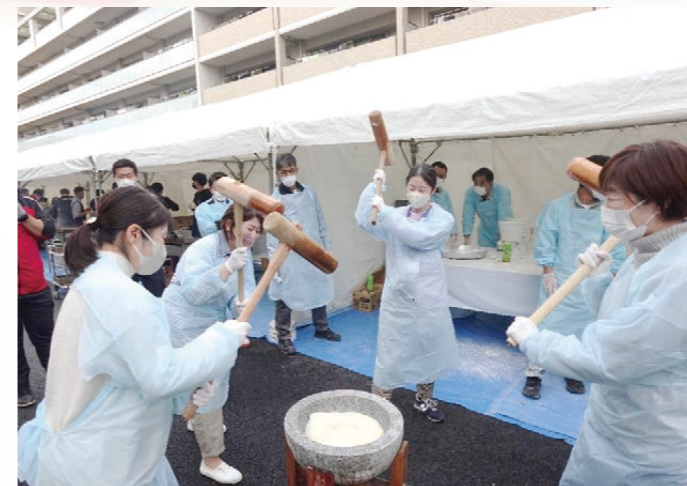
来場者に振る舞う餅つきの様子