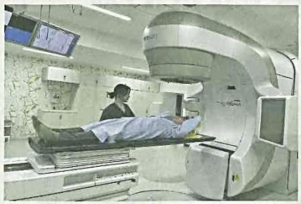
放射線治療装置 (リニアック)